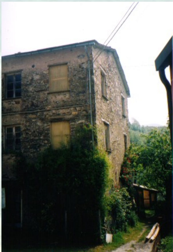
-La "Casa Nuova" -